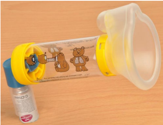
Abb. 1 ◀ Inhalationshilfe Aerochamber mit Gesichtsmaske

ka, die weniger als 3 h anhalten, oder \beta -2-Sympathomimetika-Bedarf, welcher bereits über mehr als 24 h anhält.